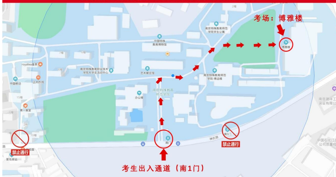
图1 南京特殊教育师范学院南1门至博雅楼